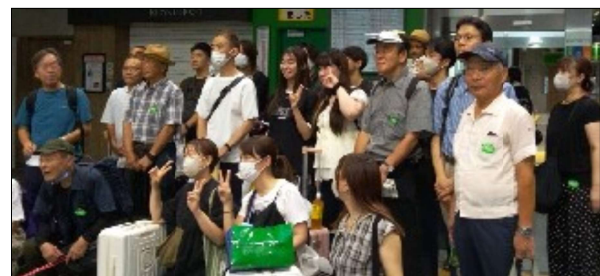
いざ世界大会へ（甲府駅にて）