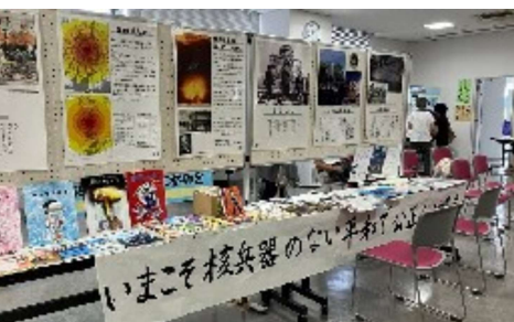
山梨市は市役所 1階で展示

高校生の絵のDMをヒ ロシマ原爆資料館から 貸借し、63枚県本部 で作成した。（貸し出 しと販売用） ③各支部・班でのパネ ル展と創意工夫を見え る化し交流する機会を